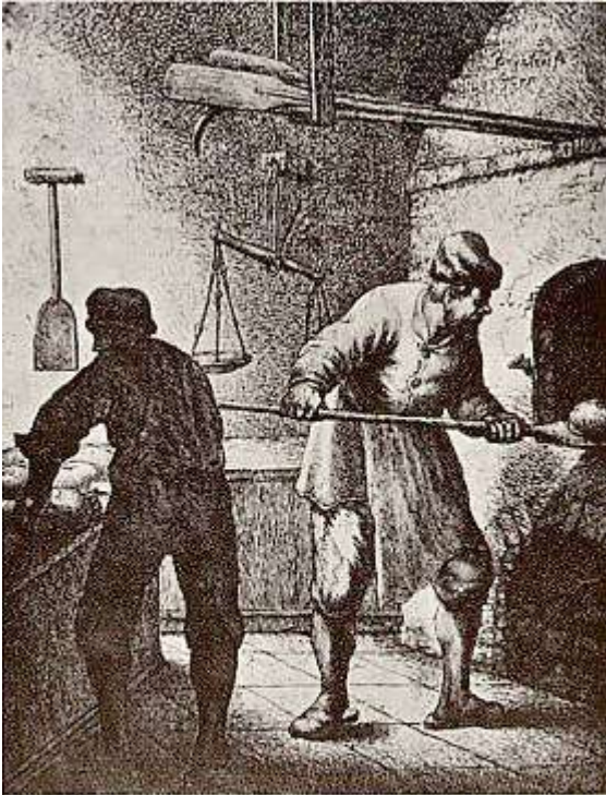
Broodbakkerij uit den aanvang der 17e eeuw. Rechts schiet de bakker het brood in den oven: links is de trog, waarin het deeg wordt gekneet, maar waarop nu de broodbollen liggen.

in het woordenboek is voor bakker 1 omschrijving gevonden: m. (-s), iem. die brood bakt