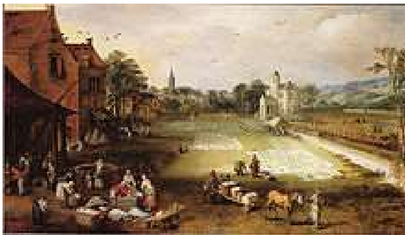
"Bleekveld in een dorp", door Jan Brueghel de Jonge

Een bleekweide , bleekveld of bleek is een kort gemaaid grasweide , die ervoor diende om linnen te bleken. Omdat de begijnen vaak hun inkomsten verdienden door de was te doen voor anderen, was de bleekweide een onmisbaar deel van het begijnhof .