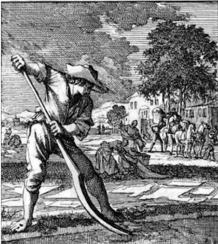
Jan van Luijken

De Bleeker. Wat pocht ghy op uw Sind'lyckheid, Die't Kleed der Zielen vuyl verslyt.