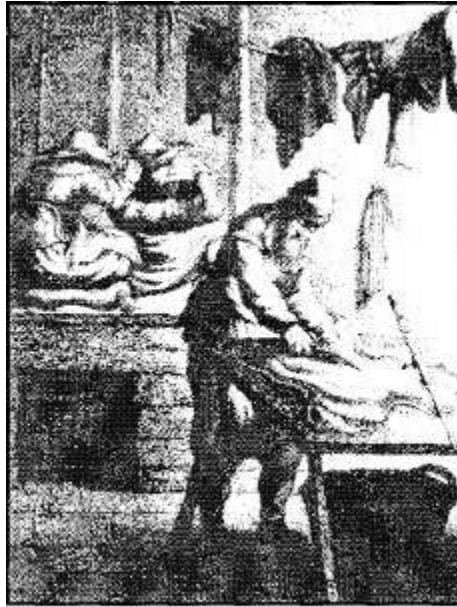
Kleermaker (Jan van Vliet 1635)